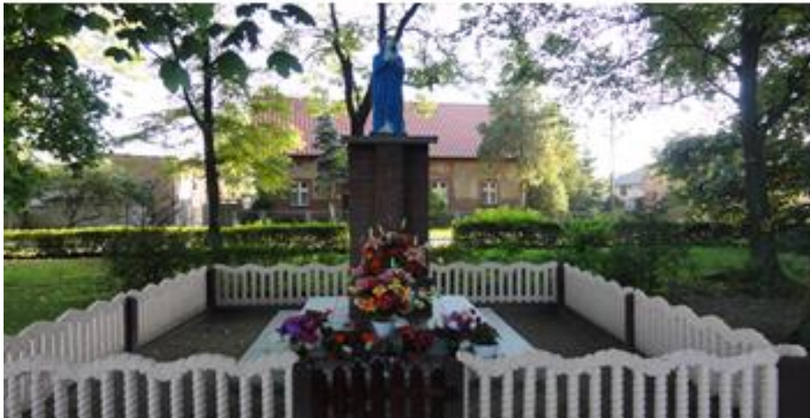
Figura Matki Boskiej przy wjeździe do parku

Na skraju parku, przy bramie wjazdowej, znajduje się również figura Matki Boskiej, usytuowana jest na kamiennym cokole. To właśnie przy tej figurze odprawiane były kiedyś msze święte.