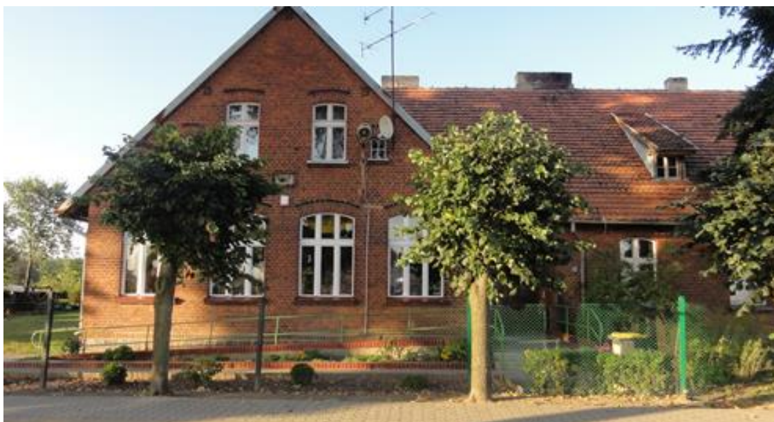
Budynek dawnej szkoły w Koninie

Obecnie mieszczą się mieszkania komunalne oraz Świetlica Wiejska i siedziba Stowarzyszenia Miłośników Konina.