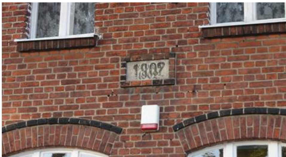
Tabliczka upamiętniająca rok budowy szkoły (1902 r.)