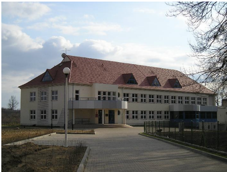
Rys. Szkoła Podstawowa w Lwówku

się w nowoczesnym budynku, w pełni przygotowanym do działalności edukacyjnej, powstałym na potrzeby wygaszonego gimnazjum. W szkole pracuje 29 nauczycieli i 12 pracowników administracyjno-obsługowych. Do szkoły w Lwówku uczęszczają dzieci z Lwówka, Grońska, Józefowa i Pawłówka. O zabezpieczenie środków transportowych i organizację dowozu dzieci i młodzieży dba gmina.