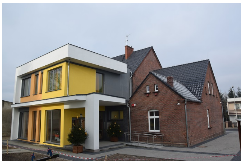
Rys. Żłobek w Lwówku