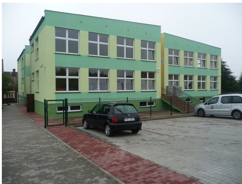
Rys. Przedszkole w Lwówku