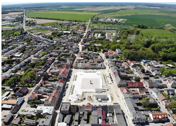
Rys. Lwówek z lotu ptaka

Dokument jest zgodny z powstającą Strategią Rozwoju Gminy Lwówek oraz ze Studium uwarunkowań i kierunków zagospodarowania przestrzennego gminy, i stanowi ich uzupełnienie.