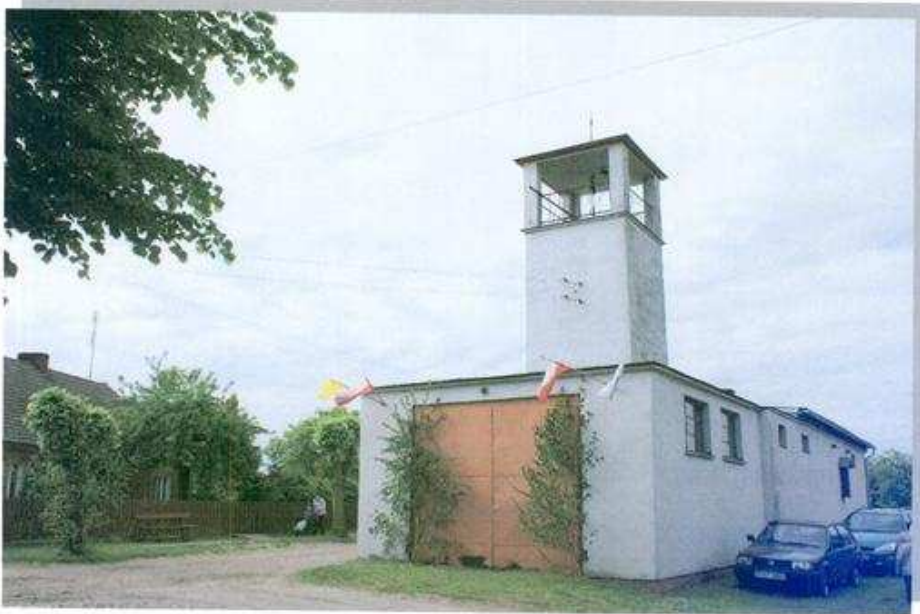
Ochołnicza Straż Pożarna