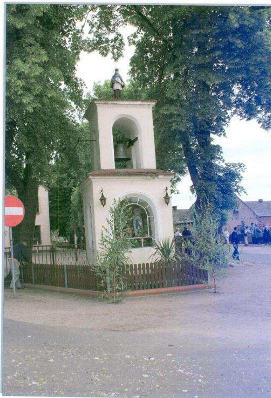
Dzwonnica Św. Jana

Obok kapliczki znajduje się „Lipa Wolności”. W kronice zapisano: „W 10-tą rocznicę Niepodległości Polski 1928 roku posadziła szkoła wraz z starszym społeczeństwem „Lipę Wolności” w środku wsi. Lipa ta rośnie do dnia dzisiejszego.