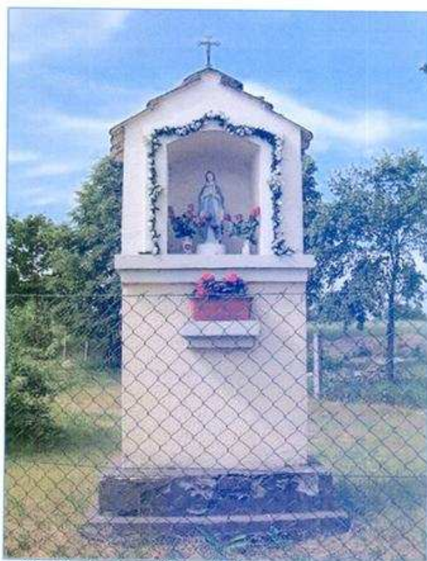
Kapliczka Matki Boskiej