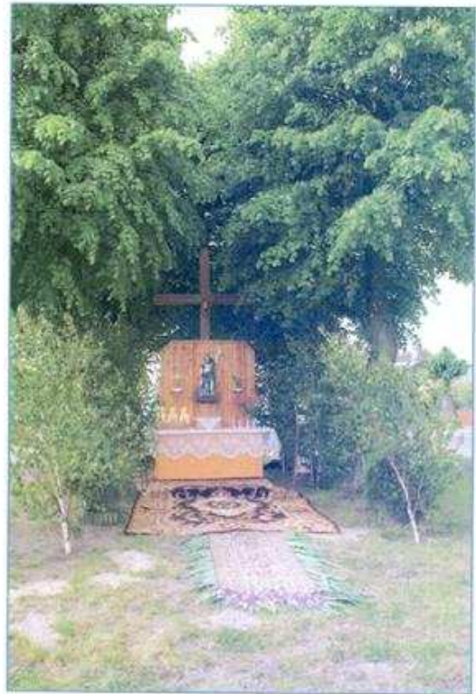
Krzyż w centrum wsi