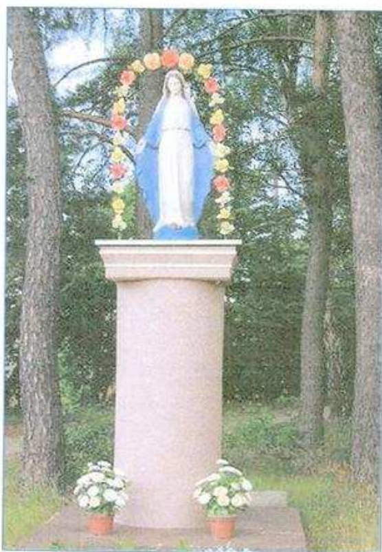
Figura Matki Boskiej

Niedaleko strażnicy znajduje się krzyż upamiętniający przyjazd biskupa w celu powołania nowej parafii w roku 1956. Przy drodze do Linia, na skraju zabudowań, wznosi się murowana kapliczka z początku XX wieku, z figurą św. Józefa, natomiast na skrzyżowaniu dróg do Lewic znajduje się kapliczka Matki Boskiej. Przy wjeździe do wsi, przy boisku sportowym stoi między drzewami figura Matki Boskiej.