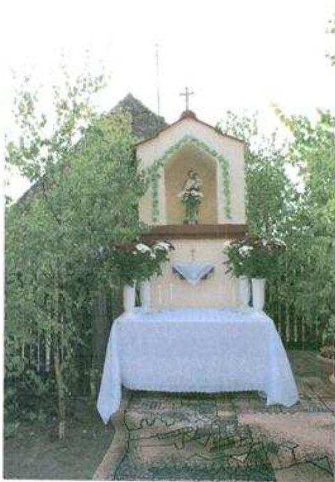
Figura Św. Józefa