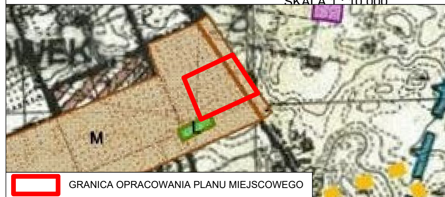
WYRYS ZE STUDIUM UWARUNKOWAŃ I KIERUNKÓW ZAGOSPODAROWANIA PRZESTRZENNEGO MIASTA I GMINY LWÓWEK SKALA 1 : 10 000