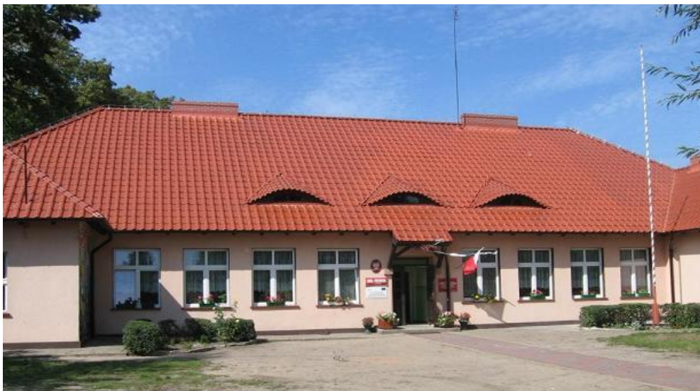
Szkoła Podstawowa w Grońsku.

Szkoła Podstawowa w Grońsku położona jest przy Drodze krajowej nr 92. Budynek szkolny został oddany do użytku w 1956 roku. We wsi szkoła natomiast istnieje już od ponad stu lat. Większość zwyczajów i imprez środowiskowych zachowała się w niej do dziś. Zawsze była centrum kulturalnym wsi, integrując społeczność lokalne, które po dzień dzisiejszy angażuje się w życie szkoły. Nauczyciele i uczniowie współpracują z działającymi we wsi organizacjami.