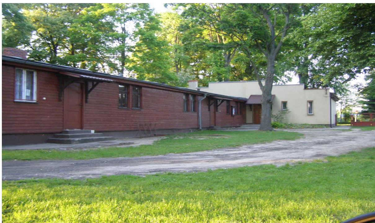
Planowany teren przed świetlica wiejską do zagospodarowania