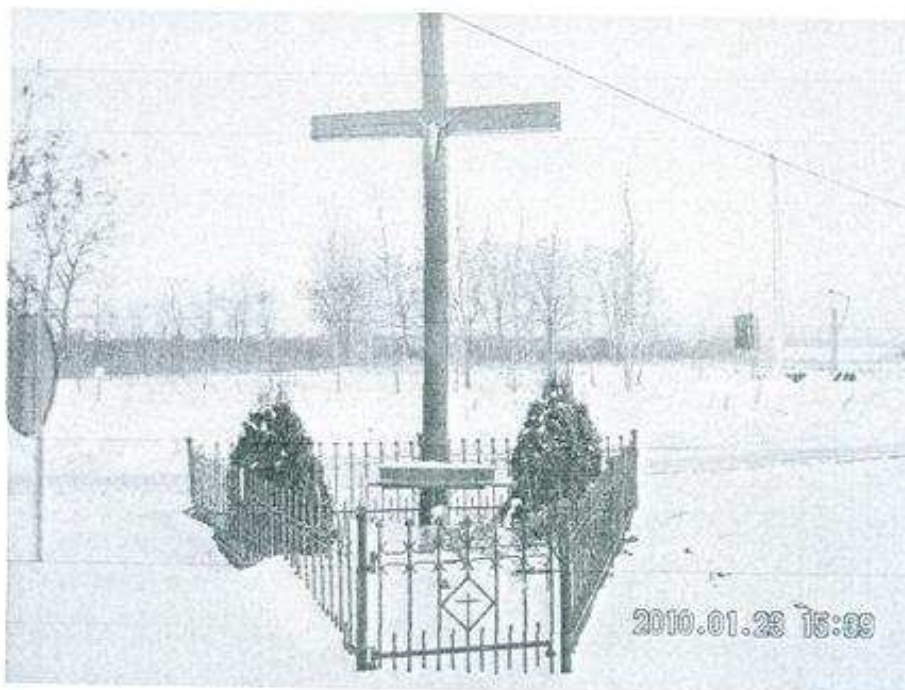
Krzyż stojący po środku wsi.