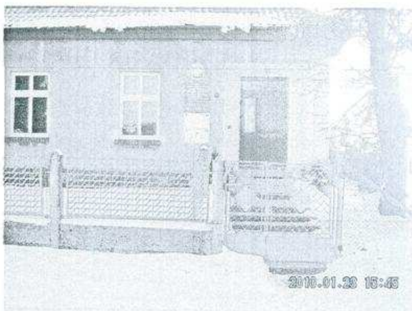
Budynek nowej szkoły z 1920 roku, obecnie Przedszkole.