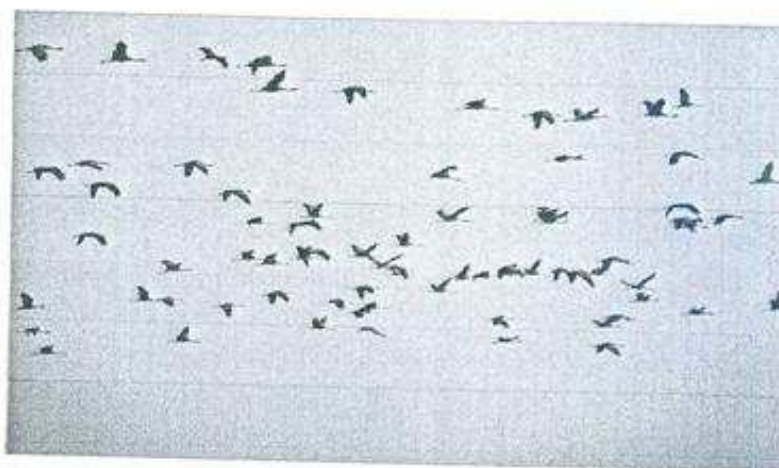
Fot. 2. Żurawie Grus grus przelatujące nad Jezioro Zgierzynieckim.

Na terenie Jeziora Zgierzynieckiego stwierdzono do tej pory występowanie 156 gatunków ptaków, z których około 80 tutaj gniazduje. Potwierdzono tu gniazdowanie 14 gatunków znajdujących się w Zał. I DP (bąk, bączek, kania ruda, trzmielojad, błotniak stawowy, kropiatka, zielonka, żuraw, rybitwa czarna, dzięcioł czarny, dzięcioł średni, podróżniczek, gąsiorek, ortolan) oraz 6 gatunków wpisanych do Polskiej czerwonej księgi zwierząt (bąk, bączek, zielonka, rybitwa białoskrzydła, podróżniczek, wąsatka).