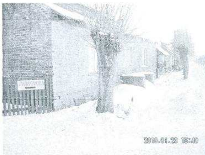
Budynek starej szkoły z 1868 roku.