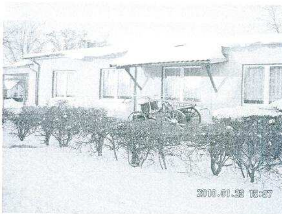
Świetlica wiejska wybudowana w 1968 roku.