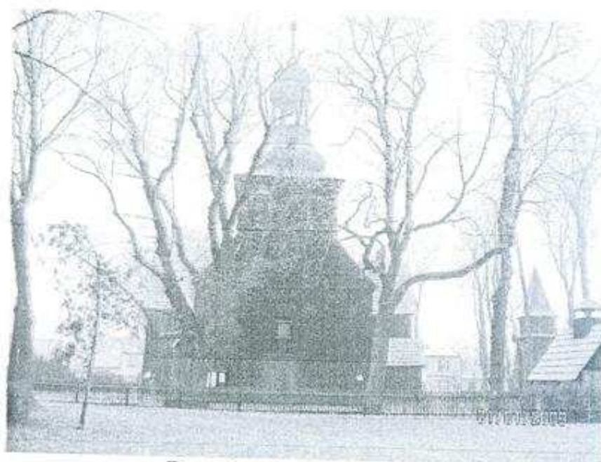
Drewniany Kościół w Brodach

Zgierzynka należy do parafii Rzymskokatolickiej p. w. Św. Andrzeja Apostoła w Brodach, gdzie znajduje się piękny zabytkowy drewniany kościół z końca XVII wieku.