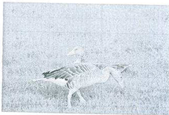
Fot. 4. Gęsi gegawy Anser anser .

Z ptaków gniazdujących na tym terenie na szczególną uwagę zasługują (dane z roku 2005 i 2006): bąk (5), gegawa (16–18 par), kania ruda (1 para), błotniak stawowy (4 pary), trzmieljad (1 para), żuraw (4 pary), zielonka (1 para), wodnik (16–17 par), rybitwa czarna (16–18 par), dzięcioł średni (4 pary), wąsatka (4 pary) i podróżniczek (5 par).