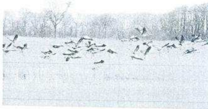
Fot. 3. Jezioro Zgierzynieckie ma duże znaczenie jako noclegowisko żurawi Grus grus .

W okresie wędrówek teren jeziora jest też miejscem odpoczynku i noclegowiskiem gęsi zbożowych i białoczelnych. Liczba nocujących tu gęsi nie przekracza zazwyczaj 4000 osobników, jednakże na polach otaczających jezioro, zwłaszcza od strony wsi Posadowo, w okresie wiosennym wielokrotnie obserwowano żerujące, mieszane stada gęsi liczące nawet ponad 10 000 osobników. Część tych ptaków nocuje najprawdopodobniej na jeziorach położonych dalej na północ, w Sierakowskim Parku Krajobrazowym.